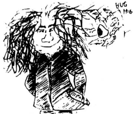
Face Hugger of Whatever