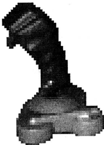
So sieht er aus, der neue Vibrator aus dem Hause Beathe Uhse!

Im Hause HJT wurden inzwischen alle Vibrator-Tests unterbunden und den weiteren Test oder Gebrauch dieser Teile unter hohe Strafe gestellt. "Im Extremfall fliegen die aus dem HJT", so Marabu, der gleich darauf Hexenmeister entließ!