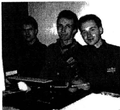
Zwei HJTler und ein externer Freak vollzogen den Vibrator-Tests!

Wie wir aus zuverlässigen Quellen erfahren haben, arbeitet ein kleiner Teil des HJTs neben dem Rundschlag auch zusätzlich für den bekannten Sex-Shop Beathe Uhse.