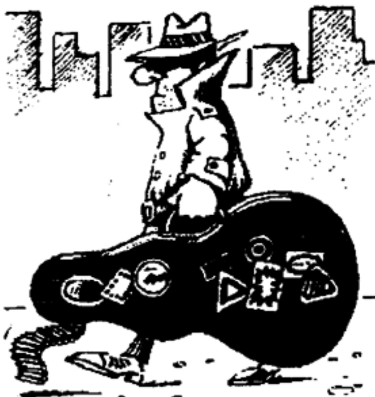
Bad Odeur of BENG! auf dem Weg zum TGS-Meeting des Jahres 1993

te Crime diesmal uebrigens nur 17 mal laden bzw. starten, statt wie auf der DOS Party 37 mal. Tja, die debuggte Crime-Version macht's! Man kann die effektive Absturzquote uebrigens wie folgt berechnen: Versionsnummer * Anzahl der BENG! Mitglieder. Durchden laufenden Ausstieg einiger BENG! members, verbessert sich diese so Crime ständig. {lien zeigte uns dann noch zusammen mit Proletron ihr neustes Werk, die Voyeur Demo. Auf diese Demo moechte ich aber nicht näher eingehen, da die Lamers International auch von Kindern