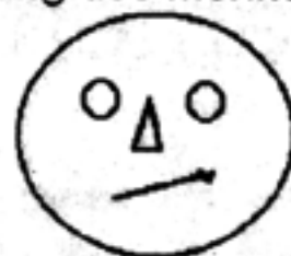
Einfach und trotzdem aussagekräftig. Der Titelscreen von Mal MitMir in Mode 2

gaherpez, einer Geschwindigkeitsbezeichnung, sein dürfte. Die 8 steht für 8Bit, welches wiederum nur teilweise zutrifft, da die Druckerschnittstelle der CPCs ja bekanntlich nur über 7Bit verfügt, wobei aber bemerkt werden muss, daß durch kleine Lötarbeiten eben dieses fehlende 8te Bit nachträglich eingebaut werden kann, was jetzt zwar nicht zum Thema gehört, aber als Hinweis für die Hardware-Schänder der CPCs als äußerst wichtig anzusehen ist. Durch das Einlöten des 8ten Bits stimmt auch wieder die Bezeichnung des Modelles 6-12-8.) Nachdem wir beim Hersteller dann erst einmal einen Umtausch der Diskette in ein anderes, nämlich des 3" (" steht für Zoll, wir erinnern uns!) Formates veranlasst hatten und die Diskette nach weiteren 4 Monaten dann endlich bei uns eintraf, konnte der erste Test des megageilensupergutenundsobestendiskettenunterstützungengrafikprogrammes überhaupt, nämlich Mal MitMir, beginnen. Das Titelbild konnte uns auf den ersten Blick leider nicht sonderlich beeindrucken. Auf den zweiten und dritten Blick allerdings beeindruckte uns die absolute Auflösung des Monitors.