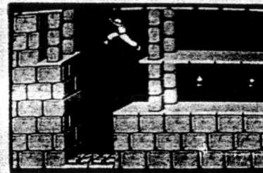
Prince of Persia