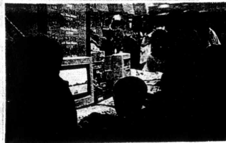
Umlagert von den Fans: Die CPC Plus auf der Amstradmesse