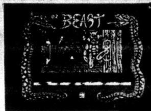
Shadow of the Beast