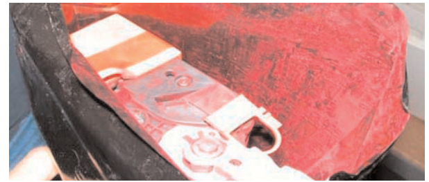
Toner magenta vaza dentro de um envelope selado de um cartucho remanufaturado durante o teste.