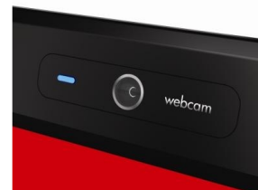
Webcam Compaq com microfones integrados