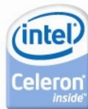
Processador Intel® Celeron 540

Todas as observações encontram-se ao final da página 2.